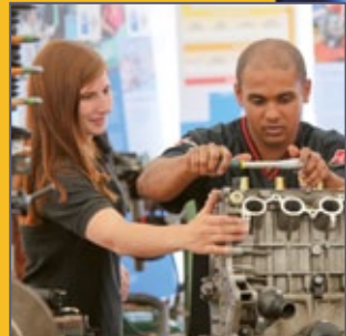
Schrauben für die Zukunft