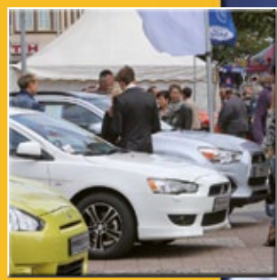
Autos warten auf Gewinner