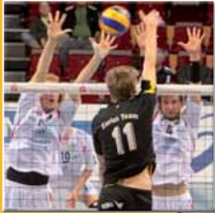
evivo blockt zaghaft ab