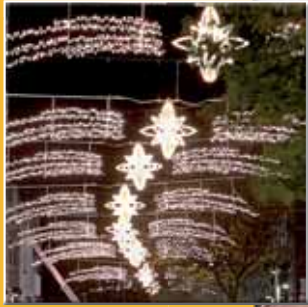
Lichterglanz in der City