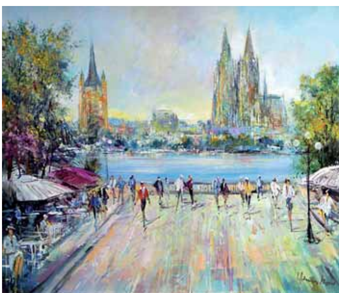
Ingfried Henze Morrò, „Am Rhein in Köln“, Gemälde, handsigniert, 70 x 80 cm

Als Thematik haben die jungen Maler charakterstarke vermenschlichte Tiere, meist Hühner oder Kühe zum Sujet ihrer Arbeiten gemacht. Weiterhin werden in der Weihnachtsausstellung ausgesuchte Gemälde und original Meistergraphiken internationaler Künstler der Galerie gezeigt. Als Geschenke zum Weihnachts-