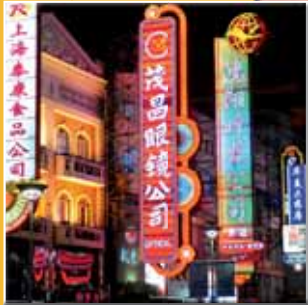
China lockt die Dürener